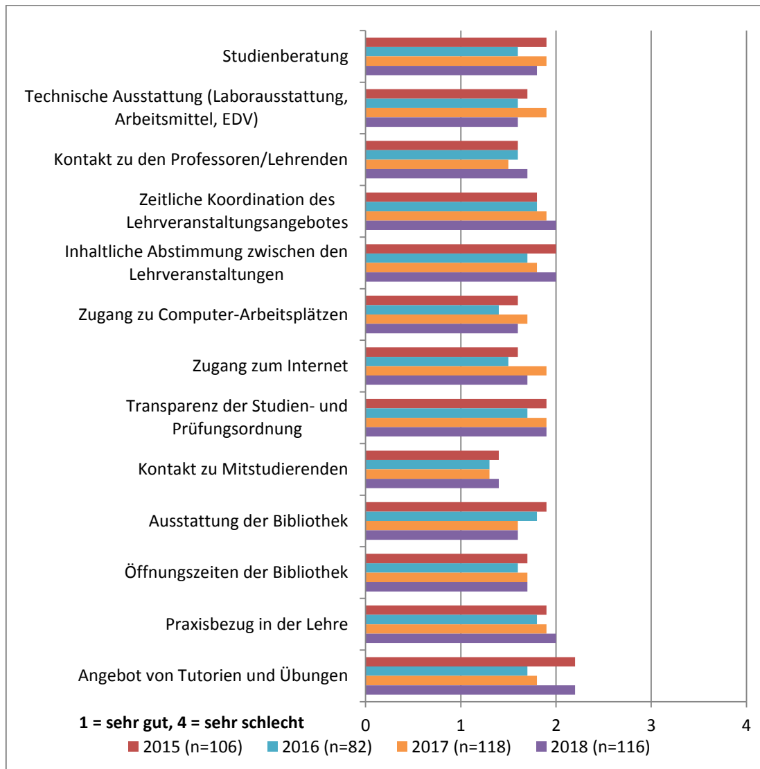
Abbildung 2: Bewertung ausgewählter Aspekte, die das Lehrumfeld betreffen

Bewertung der Ausstattung der Bibliothek und eine tendenziell schlechtere Bewertung des Zugangs zum Internet zu erkennen.